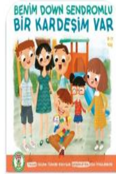
Benim Down Sendromlu Bir Kardeşim Var