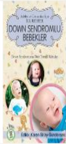
Down Sendromlu Bebekler