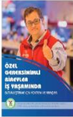
Özel Gereksinimli Bireyler İş Yaşamında