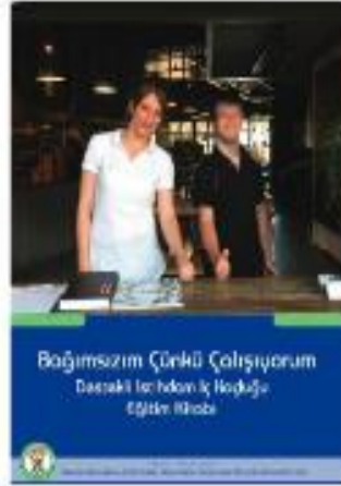
Bağımsızım Çünkü Çalışıyorum - Destekli İstihdam İş Koçluğu Eğitim Kitabı