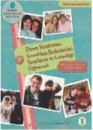
Down Sendromu Çocuklara Bedenlerini, Sınırlarını ve Cinselliği Öğretmek