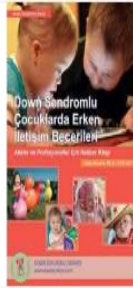
Down Sendromlu Çocuklarda Erken İletişim Becerileri